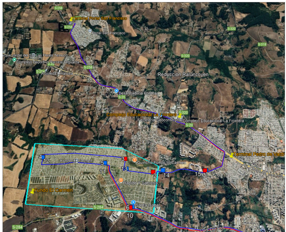
Trazado 9B actual